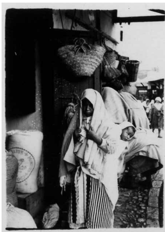
Foto del viaje al norte de África en 1935.

Poco antes de los estrenos de sus primeras obras teatrales, en marzo de 1930, Arlt se había ido como representante de “El Mundo” al Brasil, Uruguay, Colombia y las Guayanas. En 1933 viaja por algunas provincias argentinas, en 1934 a la Patagonia. En febrero de 1935, Arlt se va como corresponsal de “El Mundo” a España y el norte de África. Primero viaja por el sur de España. Su estancia en Marruecos le impresiona tanto que escribe una obra teatral llamada “África”, y una serie de cuentos. Más tarde se va al norte de España y finalmente a Madrid, donde es testigo de la victoria electoral de la izquierda en febrero de 1936 y de las ten-