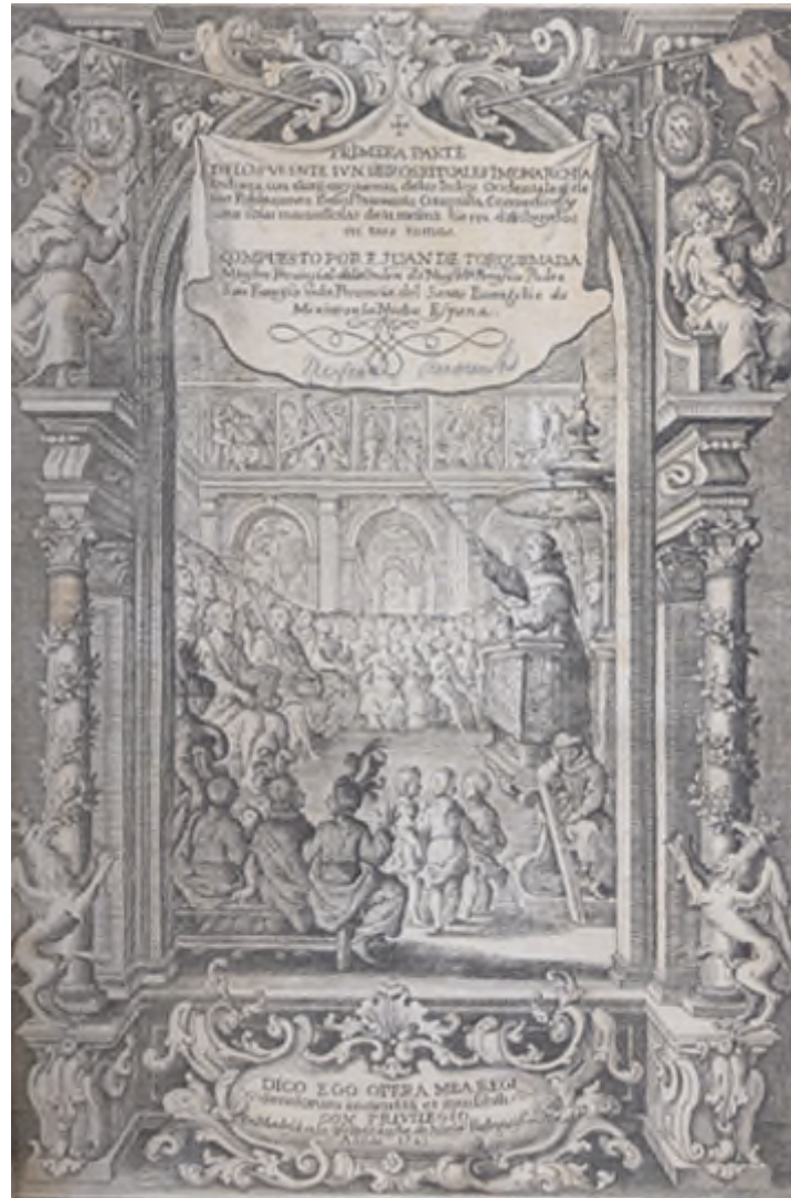
Brevisima relación de la destrucción de las Indias , de Bartolomé de Las Casas, Sevilla, 1552;